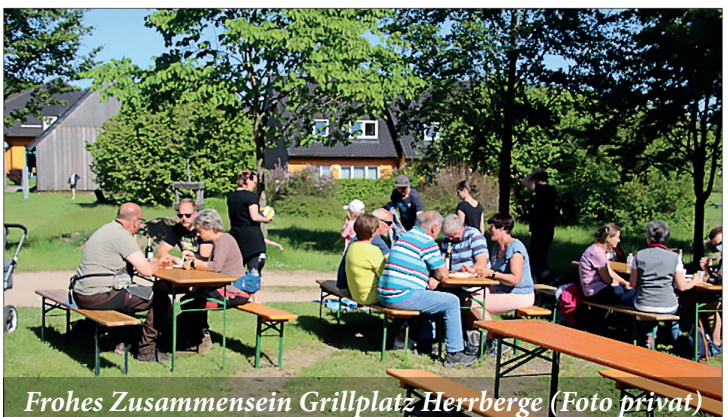
Frohes Zusammensein Grillplatz Herrberge