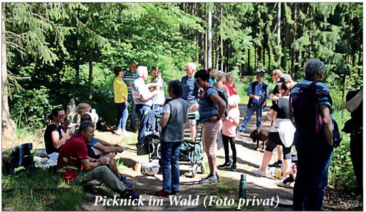
Picknick im Wald