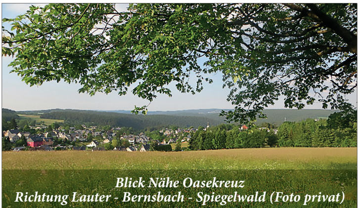
Blick Nähe Oasekreuz Richtung Lauter - Bernsbach - Spiegelwald